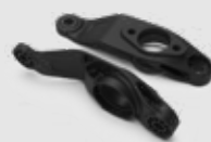
최적화된 액추에이터 브래킷