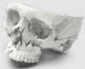
수술 계획을 위한 의료용 두개골