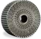
LaserForm AlSi10Mg (A) 소재의 복합 냉각 채널 내장형 열 교환기

3D Systems의 광범위한 즉시 실행 가능한 LaserForm 소재는 3D Systems DMP 프린터용으로 특별히 제조 및 미세 조정되어 높은 부품 품질과 일관된 부품 특성을 제공합니다. 3D Systems는 3D Systems의 부품 생산 시설에서 소재를 사용하여 광범위하게 개발, 테스트 및 최적화된 프린트 파라미터 데이터베이스를 제공합니다. 이러한 시설에서는 매년 다양한 소재로 백만 개 이상의 까다로운 금속 생산 부품을 프린팅하는 독보적인 전문 기술을 보유하고 있습니다.