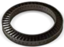
고온 내식성을 갖춘 인증된 HX(A) 소재의 터빈 날개