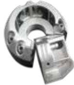
일치용 구멍이 있는 LaserForm Maraging Steel (B) 소재의 블로 성형