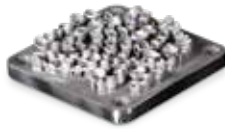
LaserForm CoCr(C) 소재의 부분상치, 코핑 및 브리지