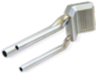
LaserForm Ni718 (A) 소재의 통합 냉각 채널 내장형 가스 버너