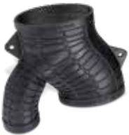
Figure 4 탄성 소재는 탁월한 형상 회복력, 압축 용도에 좋은 높은 인열 강도 및 재료 가단성이 우수해 기능성 유사 고무 부품의 생산에 적합합니다.