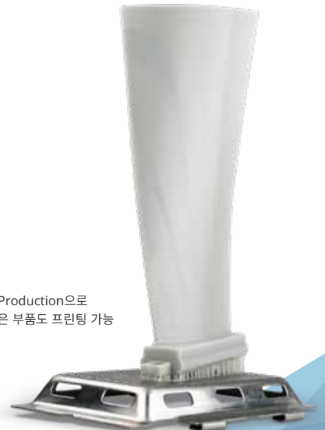
Figure 4 Production으로 높이가 높은 부품도 프린팅 가능

3D Connect Service는 안전한 클라우드 기반의 3D Systems 서비스 팀 연결을 통해 적극적인 사전 예방 지원을 제공하여 서비스 품질을 높이고, 가동 시간을 늘리며, 시스템의 생산을 보증할 수 있습니다.