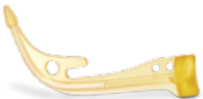
Figure 4 Production은 3D Systems의 전체 NextDent® 재료 포트폴리오와 호환되기 때문에 치과용 의료기기의 완벽한 주문 제작이 용이합니다. Figure 4 특수 재료 중에서 새크리피셜 툴링, 주열리 주조, 생체 적합성과 멸균을 요하는 의료 용도 등에 필요한 소재를 선택할 수도 있습니다.

사용 가능한 소재의 사양에 관해서는 소재 선택 장치 안내서 및 개별 소재 데이터시트를 참조하십시오.