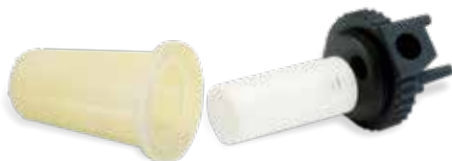
Prototype fonctionnel de filtre imprimé en plastiques rigides transparent, blanc et noir

La précision des pièces et les performances des matériaux sont parfaitement adaptées aux applications d'outillage rapide