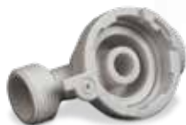
DuraForm ProX GF でプリントされたホースのフィッティング