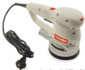
DuraForm PA 材料でプリントされた研磨機ツールハウジング

3D Systems sPro SLS システムは共通の構造を共有し、中程度から大規模造型容積で利用可能な、高解像度の、耐久性のある熱可塑性パーツをもたらします。