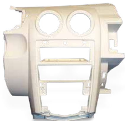
DuraForm PA ダッシュボード