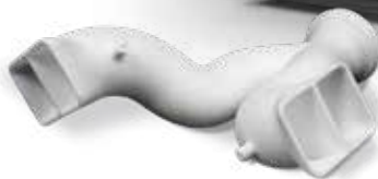
DuraForm ProX FR1200 でプリントされたマニフォールド