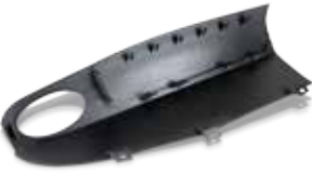
Der neue Rigid Black-Kunststoff Visijet® CR-BK bietet noch bessere mechanische Verbundmaterial-Eigenschaften

Ihre Produkte bestehen aus verschiedenen Materialien? Dann können Sie nun auch Ihre 3D-Prototypen mit unterschiedlichsten Flexibilitäts-, Transparenz- und Farbeinstellungen in einem Vorgang drucken. Und das unter Berücksichtigung realistischer, mechanischer Eigenschaften für große und kleine Teile.